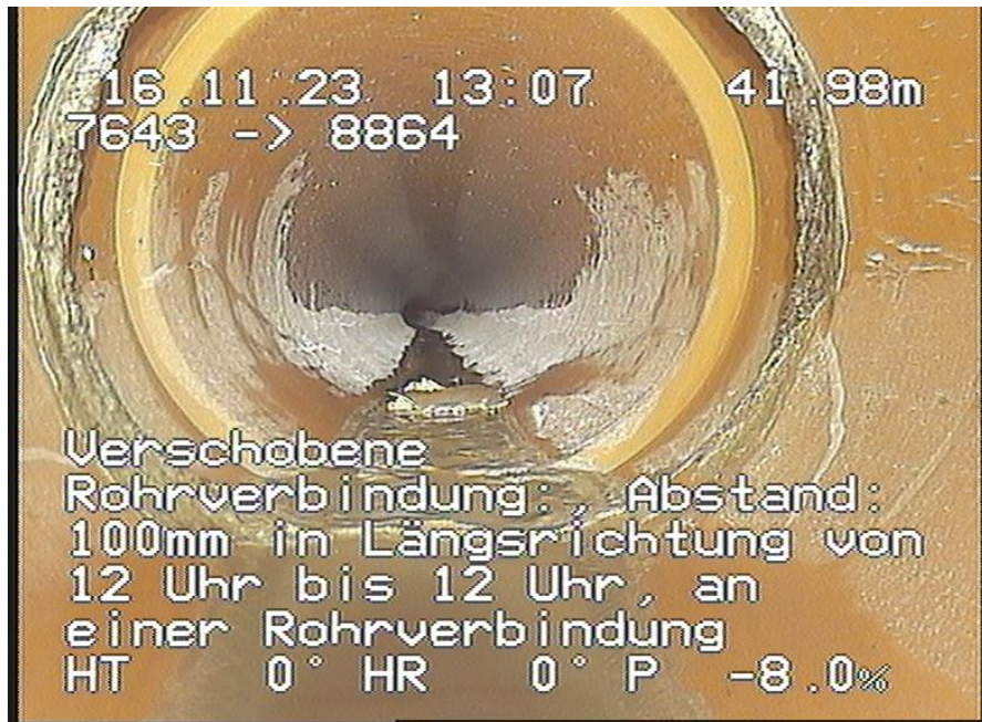
7643-8864_231116_130422_0471.jpg, 00:03:19, 41.98m Verschoebene Rohrverbindung: Abstand: 100mm in Längsrichtung von 12 Uhr bis 12 Uhr, an einer Rohrverbindung