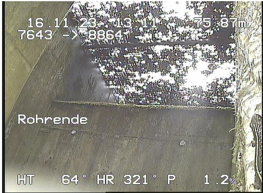
7643-8864_231116_130422_0473.jpg, 00:06:37, 75.87m Rohrende