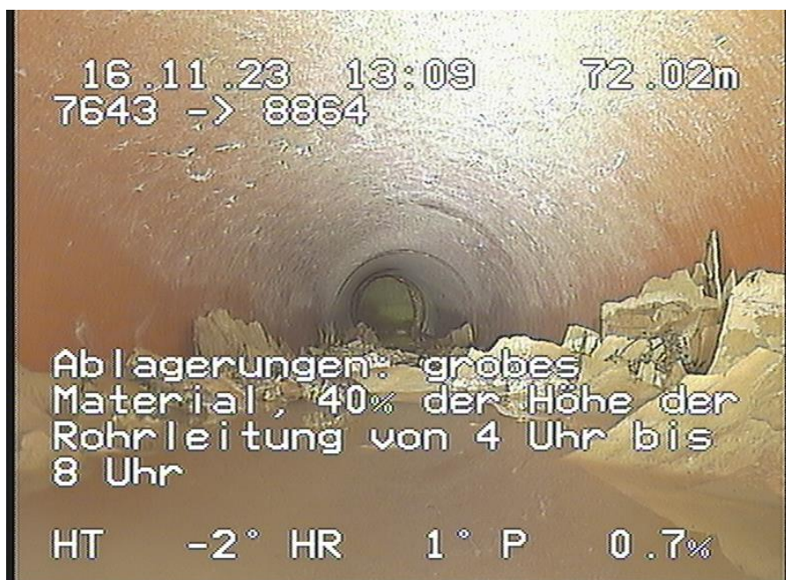
7643-8864_231116_130422_0472.jpg, 00:04:59, 72.02m Ablagerungen: grobes Material, 40% der Höhe der Rohrleitung von 4 Uhr bis 8 Uhr